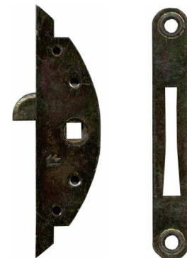
BASTRELLE ET GACHE