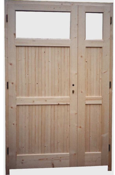
PORTE DE SERVICE TIERCÉ AVEC DEUX PANNEAUX, DEUX CARREAUX ET TRAVERSE INTERMÉDIAIRE.