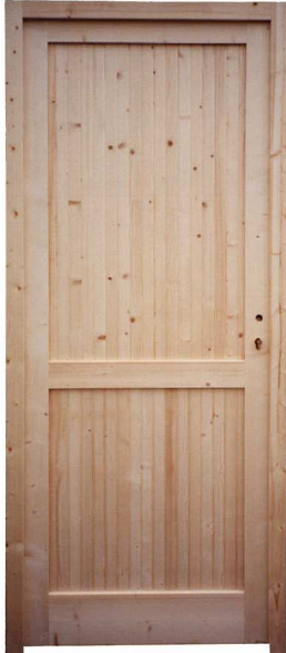
PORTE DE SERVICE STANDARD AVEC DEUX PANNEAUX ET TRAVERSE INTERMÉDIAIRE.