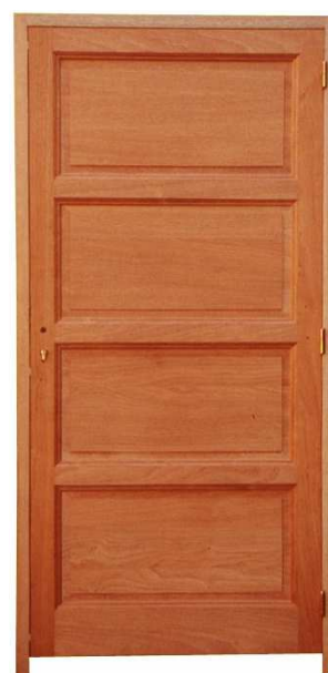
4 PANNEAUX MASSIF HORIZONTALAUX.