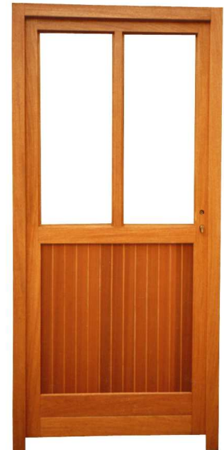
PORTE DE SERVICE UN PANNEAU, DEUX CARREAUX ET TRAVERSE INTERMÉDIAIRE.