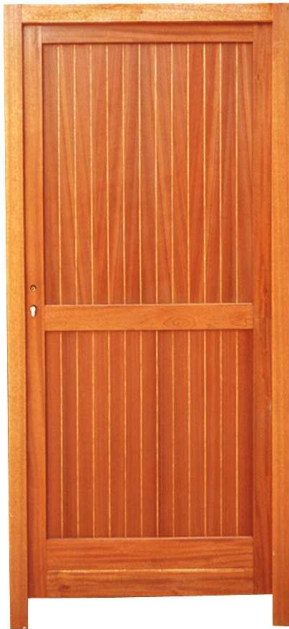
PORTE DE SERVICE STANDARD AVEC DEUX PANNEAUX ET TRAVERSE INTERMÉDIAIRE.