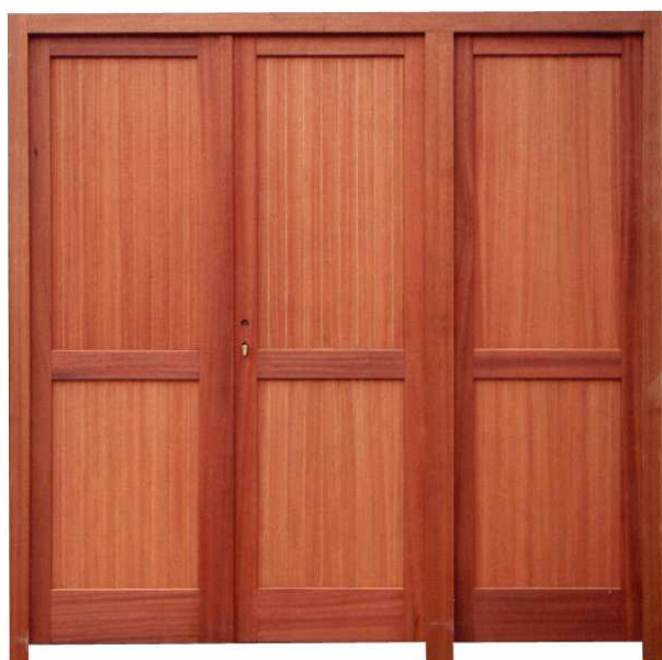
3 VANTAUX AVEC MENEAU.